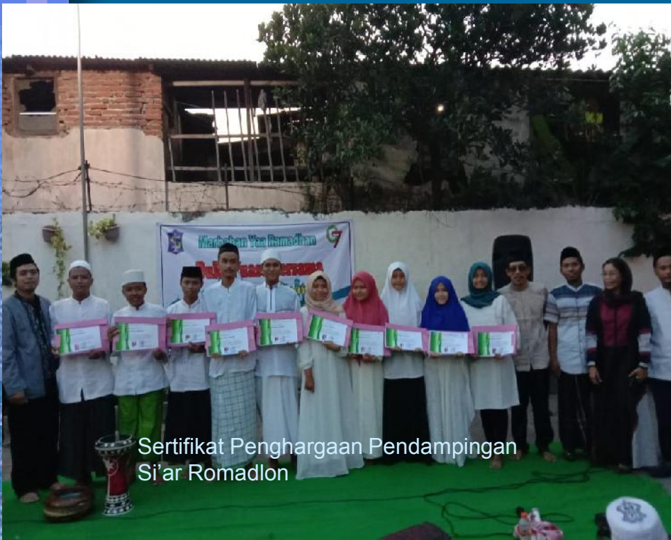
Sertifikat Penghargaan Pendampingan Si'ar Romadlon