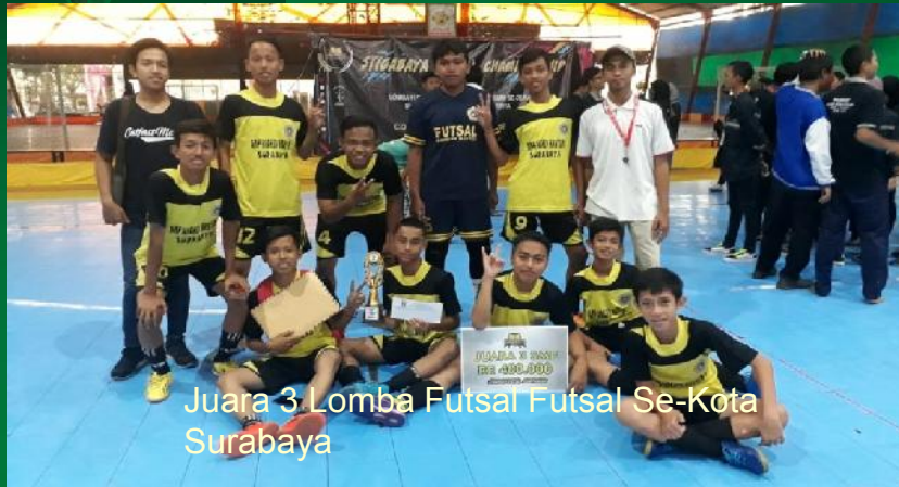
Juara 3 Lomba Futsal Futsal Se-Kota Surabaya