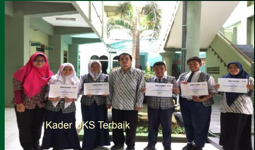
Kader UKS Terbaik