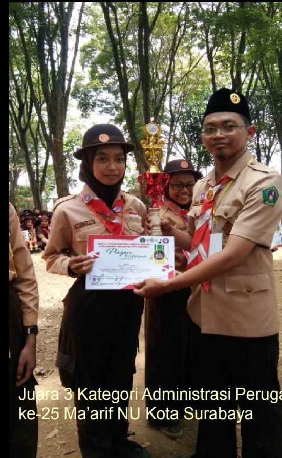
Juara 3 Kategori Administrasi Peruga ke-25 Ma'arif NU Kota Surabaya