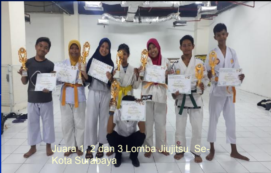
Juara 1, 2 dan 3 Lomba Jujitsu Se-Kota Surabaya