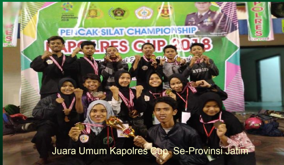
Juara Umum Kapolres Cup Se-Provinsi Jatim