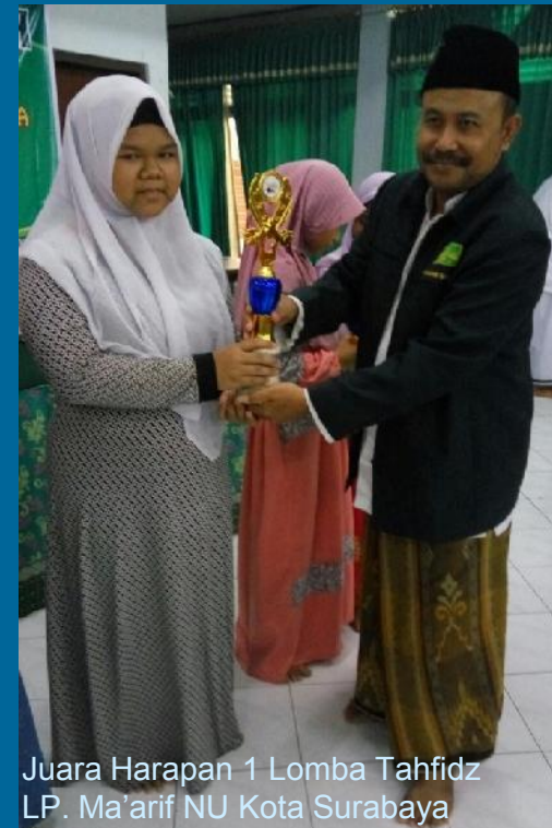
Juara Harapan 1 Lomba Tahfidz LP. Ma'arif NU Kota Surabaya